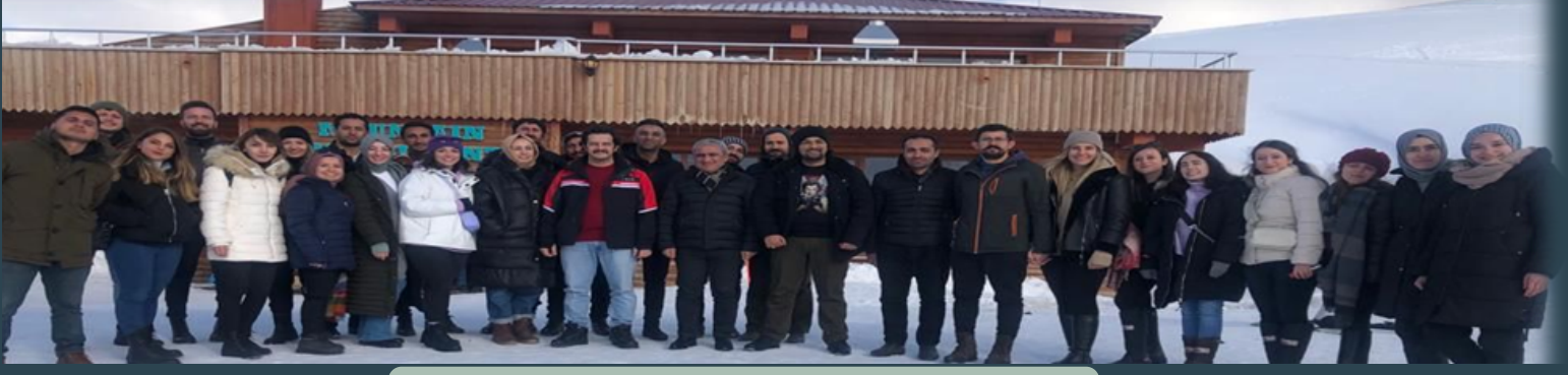
ÖĞRETMENLERİMİZLE KAYAK ETKİNLİĞİ