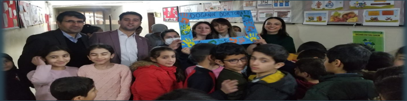
DOĞANIN DOKTORU PROJE ÇALIŞMASI