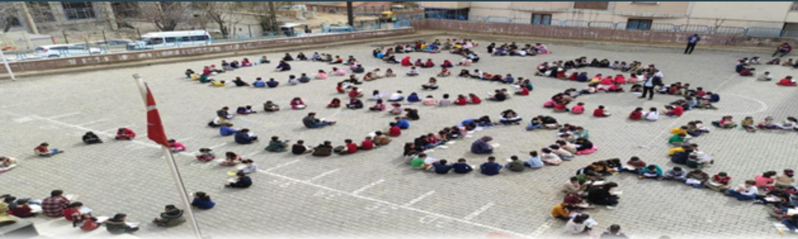
KİTAP OKUMA ETKİNLİĞİ