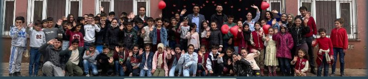
OTİZM FARKINDALIK GÜNÜ