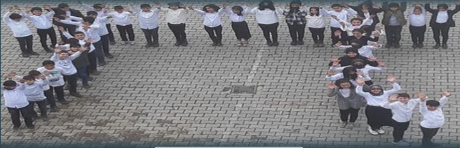
14 MART Pİ GÜNÜ ETKİNLİĞİ