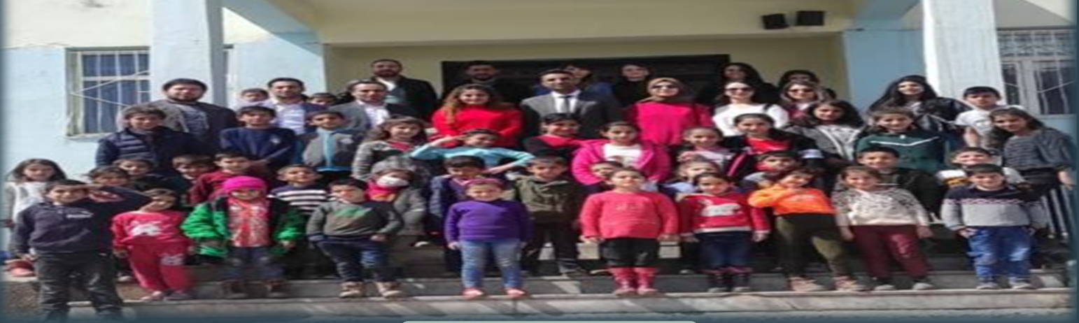
KONUR KÖYÜ ZİYARETİ