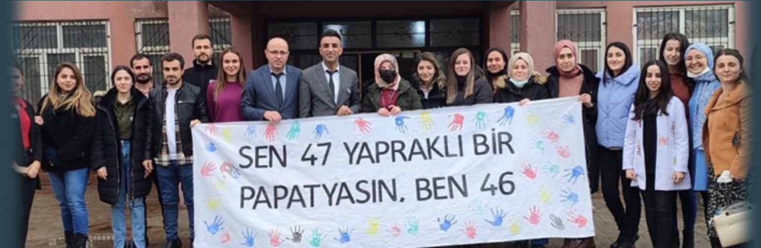
DOWN SENDROMU FARKINDALIK GÜNÜ